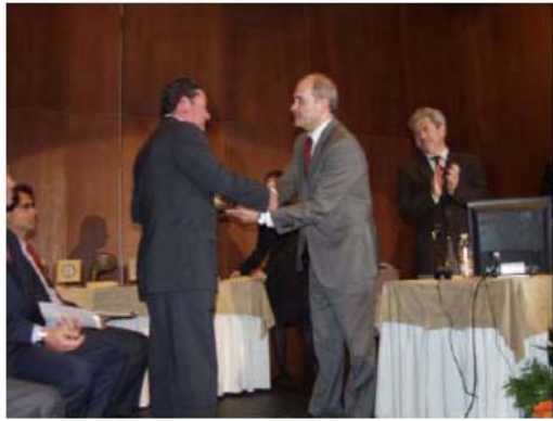
Entrega Mención al Liderazgo