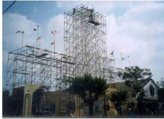
Ejemplo de colaboración en actividades culturales

En este punto nos parece importante destacar que estos días vamos a firmar un convenio de colaboración con la Junta de Andalucía a través de ASECOM para contribuir al Plan de Calidad Ambiental de Huelva. Este acuerdo lo firmará ASECOM y luego cada empresa participante (PROYESUR, en este caso). Cuando esto se confirme será un hito relevante ya que los participantes son en su mayoría las grandes empresas de Huelva, y seríamos la primera PYME en colaborar.