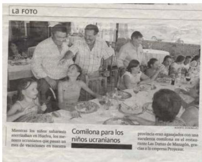
Ejemplo de colaboración con entidades sociales