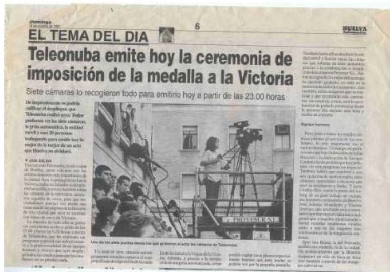
Ejemplo de colaboración con medios de comunicación