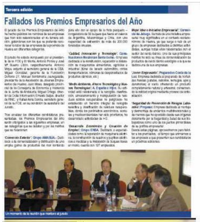
Noticia aparecida en "el boletín" de FOE ( nº 27 mayo 2003) donde se informa de los ganadores de los Premios Empresarios del Año