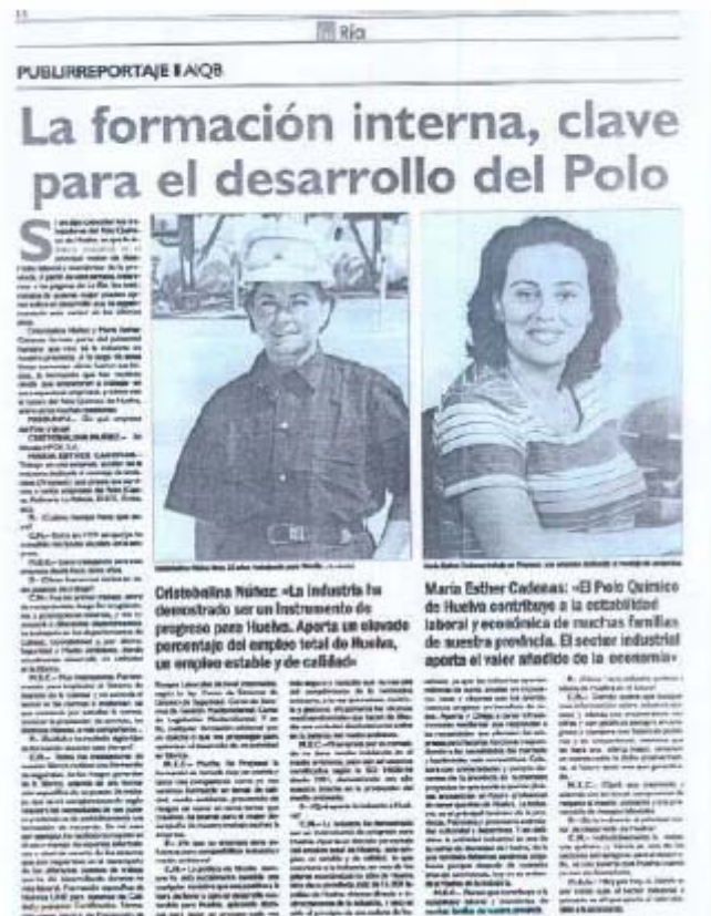
Ejemplo de colaboración de nuestra Coordinadora de Calidad y Medio Ambiente con medios de comunicación

Colaboración en temas sociales, como es la comida dada recientemente a niños ucranianos residiendo temporalmente en la zona.