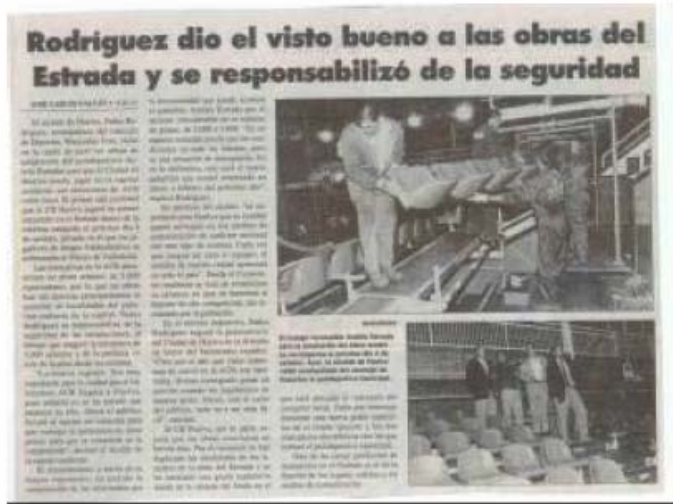
Ejemplo de colaboración en actividades deportivas

En este punto nos parece importante destacar que estos días vamos a firmar un convenio de colaboración con la Junta de Andalucía a través de ASECOM para contribuir al Plan de Calidad Ambiental de Huelva. Este acuerdo lo firmará ASECOM y luego cada empresa participante (PROYESUR, en este caso). Cuando esto se confirme será un hito relevante ya que los participantes son en su mayoría las grandes empresas de Huelva, y seríamos la primera PYME en colaborar.